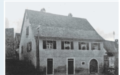
Geburts- und Wohnhaus bis 1936

„... vor meinem geistigen Auge taucht das kleine Dorf im Herzen des Kaiserstuhls auf, das im Frühling in ein wahres Blütenmeer getaucht war ...“